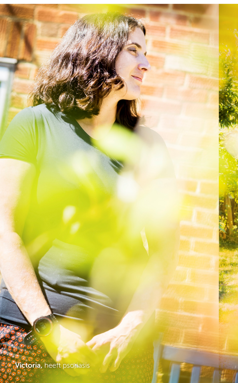
Victoria, heeft psoriasis